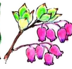
ウラジロヨウラク